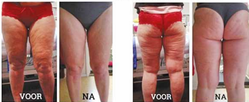
Voorbeeld lymfedrainage behandeling na 4 weken, zie hieronder het verschil

Voor een lymfedrainage behandeling heeft u geen verwijzing nodig van uw huisarts. Een vergoeding voor deze therapie is mogelijk vanuit uw aanvullende zorgverzekering, dit gaat niet van uw eigen risico af. Onze therapeuten zijn aangesloten bij de RBCZ, VBAG, MBOG en NFG. Voor informatie over vergoedingen ga naar www.orthokliniekoost.nl .